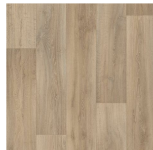
2713 2 / 3 / 4 m