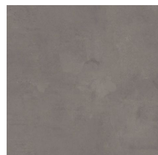
2706 2 / 3 / 4 m