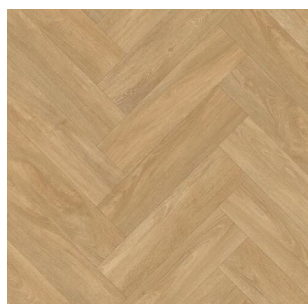
2709 4 m