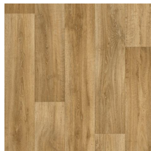
2712 2 / 3 / 4 m