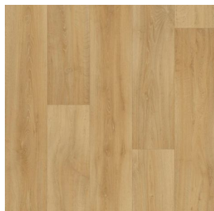
2711 2 / 3 / 4 m