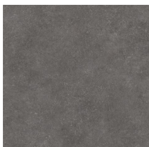
2702 2 / 3 / 4 m