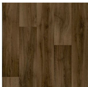
2715 4 m