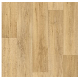
2710 2 / 3 / 4 m