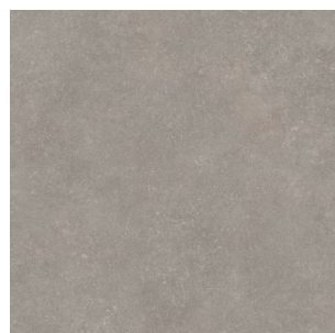
2700 2 / 3 / 4 m