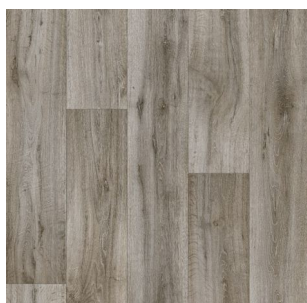
2714 2 / 3 / 4 m