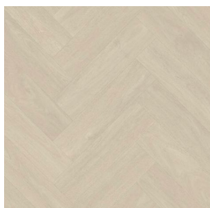
2708 4 m