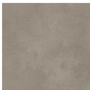
2705 2 / 3 / 4 m